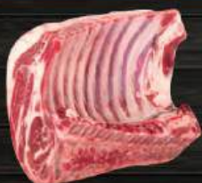
SƯỜN CỪU CÓ XƯƠNG SỐNG Lamb Rack Standard

"Thịt cừu được THIÊN VƯƠNG ACE FOODS nhập khẩu từ các thương hiệu nổi tiếng như: JBS, Midfield, Thomas, Alliance,... đảm bảo chất lượng, hương vị thơm ngon, đáp ứng các yêu cầu nghiêm ngặt về VSATTP với giá thành hợp lý"