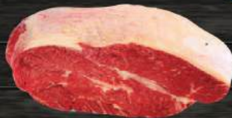
MÔNG BÒ Rump