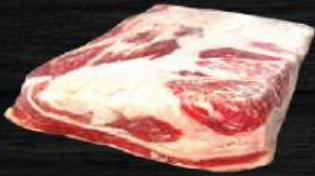
BẠ CHỈ BÒ Short Plate