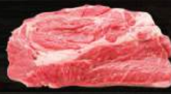
NẠC VAI BÒ Chuck Roll