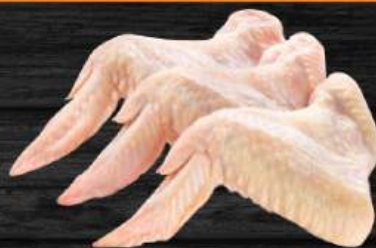
CÁNH GÀ 3 KHÚC Chicken 3 joint wings