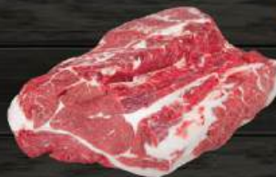
NẠC VAI BÒ Chuck Roll