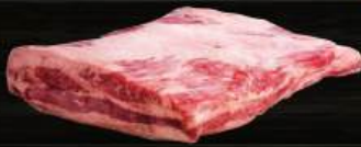
BA CHỈ BÒ Short Plate