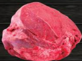
ĐŨI GỌ BÒ Knuckle