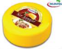
JANTAR (LOẠI ĐẶC BIỆT) Special Jantar