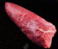
BẮP CÁ LÓC Chuck Tender