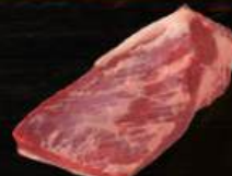
GÀU BÒ Brisket