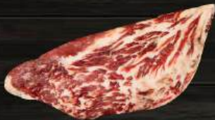
GŨ HOA BÒ Chuck Crest