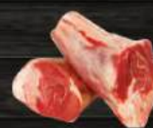
BẮP CỪU Fore Shank