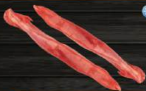
THÂN CỪU Lamb Tenderloin