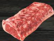
THÂN LƯNG BÒ (PRIME) Sirloin (Prime)