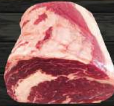
THÂN VAI BÒ Ribeye