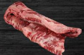
DIÊM THÂN BÒ Outside skirt