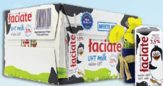
SỮA TƯƠI LACIATE NGUYÊN CHẤT Laciato Uht Milk 3.5% Fat Content