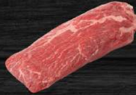
LỖI VAI BÒ Top Blade