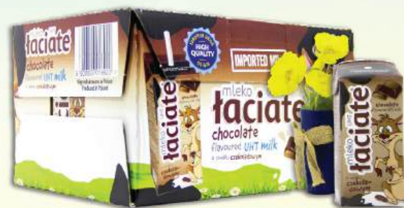
SỮA TƯƠI LACIATE VỊ SOCOLA Laciato Uht Milk - Chocolate Flavoured