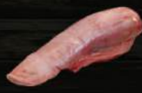
LƯỠI BÒ Tongue