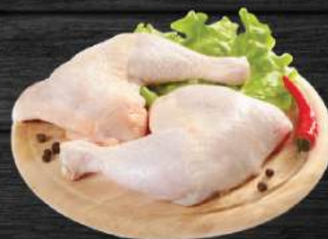
ĐÙI GÀ GÓC TƯ Chicken Leg Quarters