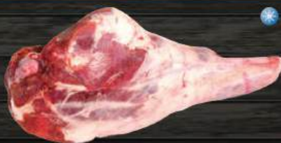
ĐŨI CỪU CÓ XƯƠNG Lamb Leg Bone-in