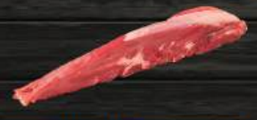
THÂN NÓN BÒ Tenderloin