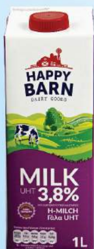
SỮA TƯƠI HAPPY BARN 3,8% UHT Milk 3.8% Fat