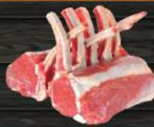
SƯỜN CỪU FRENCHED Lamb Rack Frenched