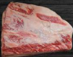
SƯỜN BÒ RÚT XƯƠNG Short Rib Boneless