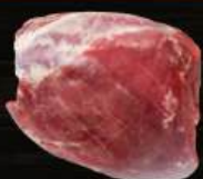
ĐŨI GỖ Knuckle