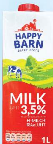
SỮA TƯƠI HAPPY BARN 3,5% UHT Milk 3.5% Fat

Phù hợp với: Dùng trực tiếp hoặc pha chế