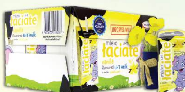
SỮA TƯƠI LACIATE VỊ VANI Laciato Uht Milk - Vanilla Flavoured