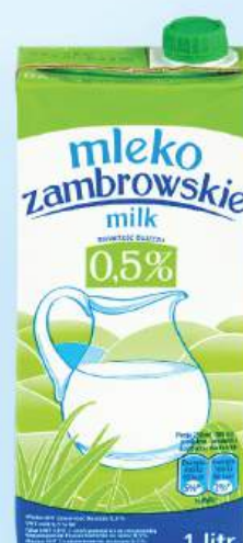
SỮA TƯƠI MLEKO 0,5% UHT Milk 0.5% Fat

Phù hợp với: Dùng trực tiếp hoặc pha chế