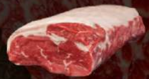
THÂN LƯNG BÒ Striploin