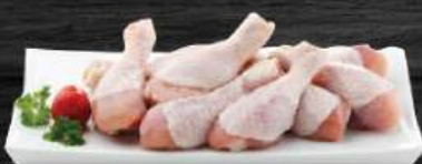
ĐÙI TỎI GÀ Chicken Drumsticks