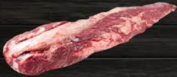
THÂN NÔN BÒ Tenderloin