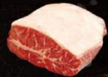
LỖI VAI BÒ Top Blade