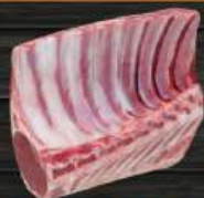
SƯỜN CỪU BỎ XƯƠNG SỐNG Lamb Rack Aussie