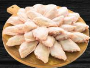
CÁNH GÀ KHÚC GIỮA Chicken Midwings