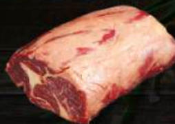
THÂN VAI BÒ Ribeye