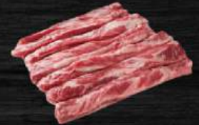
DÈ SƯỜN BÒ Rib Finger