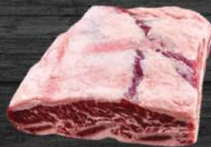
SƯỜN BÒ CÓ XƯƠNG Short Rib Bone-in