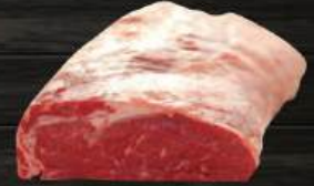
THÂN LƯNG BÒ Striploin