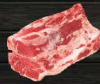
T-BONE T-bone (Shortloin)