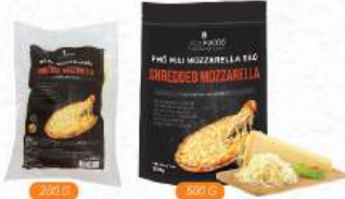
MOZZARELLA BẢO (Loại đặc biệt) Shredded Mozzarella

Thương hiệu: ACE FOODS Quy cách đóng gói: 300gr/túi Bảo quản: ≤-18°C Phù hợp với: Chiên ngập dầu, ăn kèm tương ớt/ cà