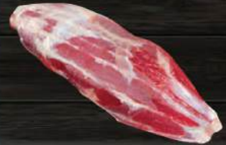
BẮP BÒ Shin/Shank