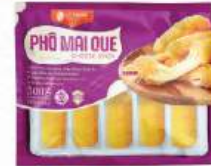
PHÔ MAI QUE Cheese stick