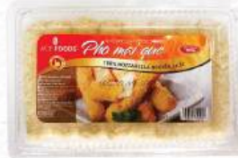
PHÔ MAI QUE 15 Mozzarella Cheese Stick