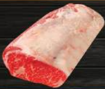
THÂN VAI BÒ (PRIME) Ribeye (Prime)

THIÊN VƯƠNG ACE FOODS tự hào là nhà phân phối độc quyền thương hiệu St Helens, Double R Ranch