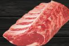
SƯỜN BÒ OP RIB OP Rib