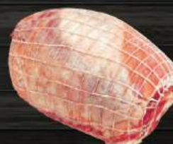
ĐŨI CỪU KHÔNG XƯƠNG Lamb Leg Boneless