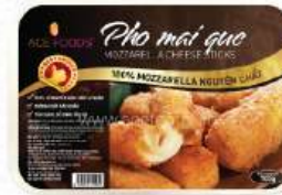
PHÔ MAI QUE 20 (ĐẶC BIỆT) Special Mozzarella Cheese Stick

Thương hiệu: ACE FOODS Quy cách đóng gói: 500gr/hộp Bảo quản: ≤-18°C Phù hợp với: Chiên ngập dầu, ăn kèm tương ớt/ cà