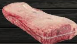
THÂN LƯNG BÒ (CHOICE) Sirloin (Choice)