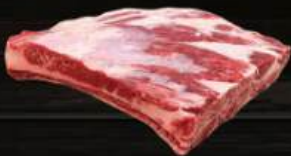
SƯỜN CỎ XƯƠNG BÒ Short Rib Bone-in