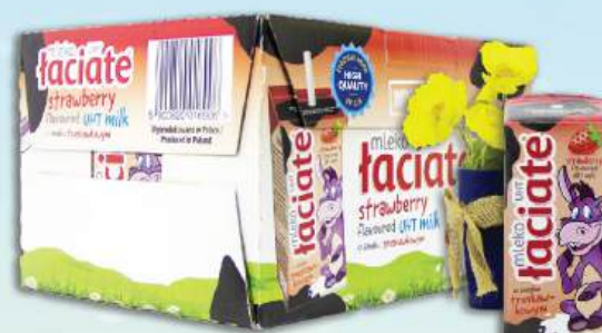
SỮA TƯƠI LACIATE VỊ DÂU Laciato Uht Milk - Strawberry Flavoured