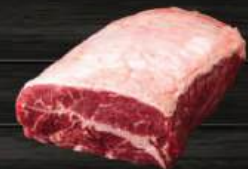
LỖI VAI BÒ Top Blade