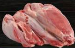
BẮP BÒ Shin/Shank