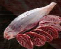
BẮP HOA Golden Cut