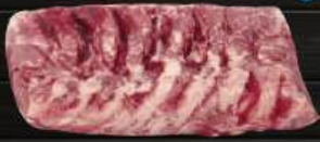
THÂN VAI BÒ (CHOICE) Ribeye (Choice)